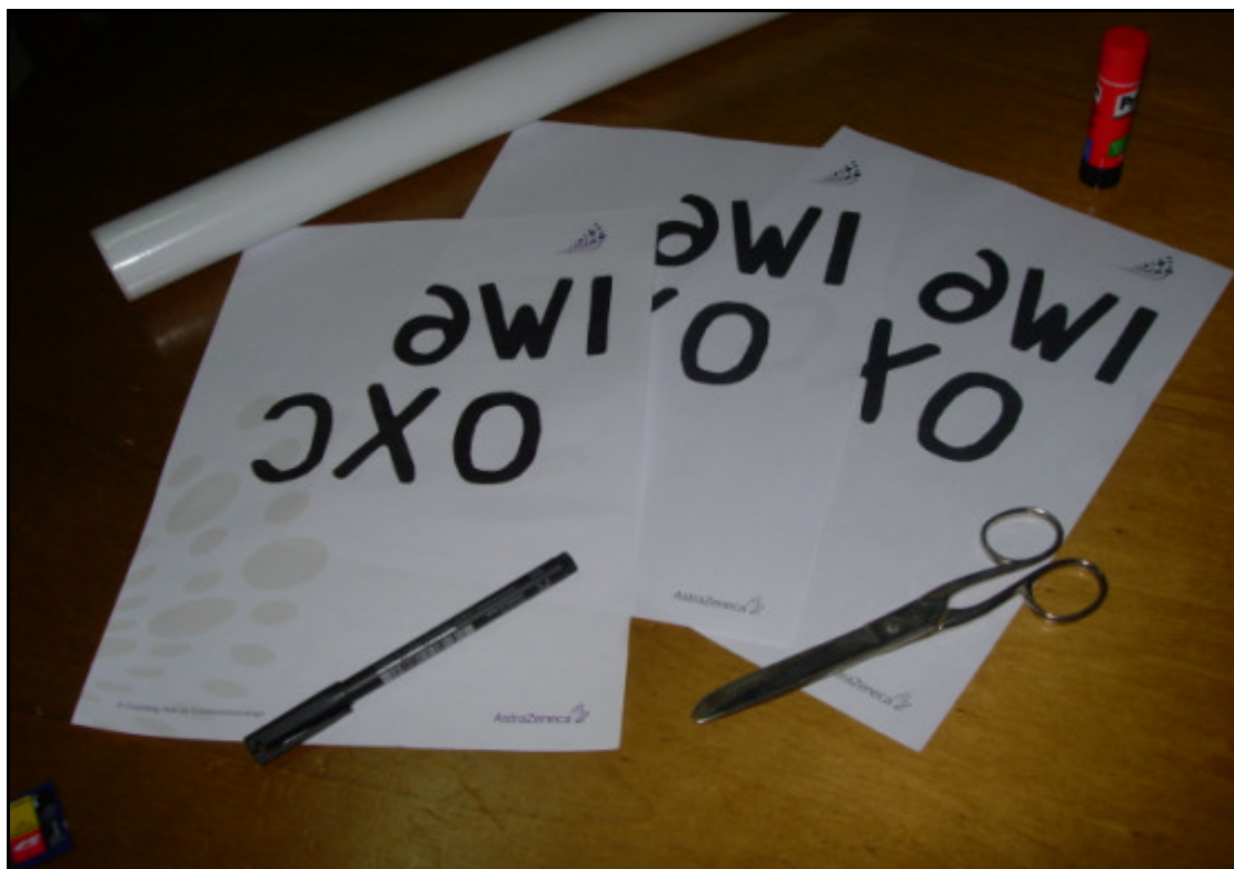
fig. n° 2